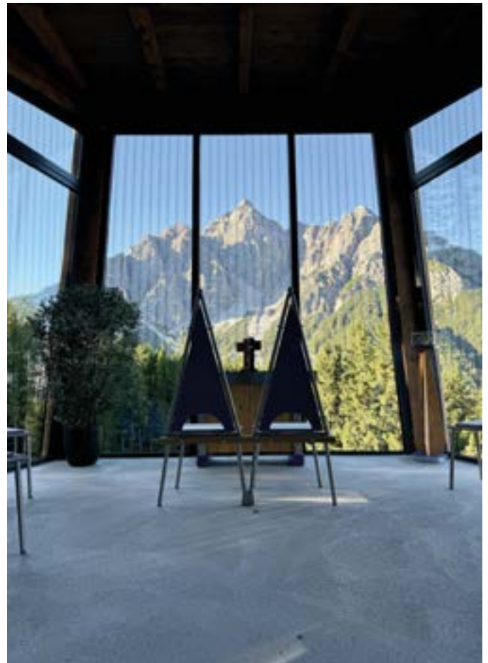
Im Innern des Serleskirchl