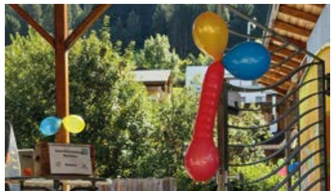
Freier Eintritt beim Saisonsabschluss