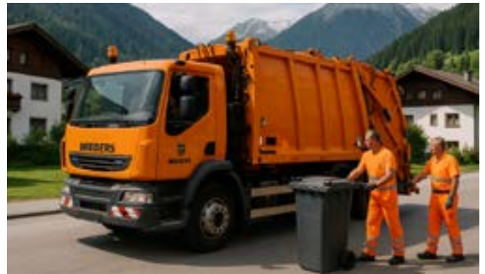
Neu Abholzeit aber weiterhin verlässlich - Bild: KI-generiert

Unser Restmüllentsorger, die Fa. Troppmair, hat uns informiert, dass ab 07.01.2026 der Donnerstag als Abfuhrtag nicht beibehalten werden kann. Faktoren wie Personalverfügbarkeit, Einsatzplanung der Fahrzeuge, Fahrzeiten und Verfügbarkeit der jeweiligen Ladekapazität machen diese Anpassung notwendig. Ab 07.01.2026 werden die Restmüllsäcke bzw. Container daher jeweils am Mittwoch abgeholt. Wir ersuchen darum, die Behälter frühestens am Vorabend des Abholtages bzw. bis spätestens 06.30 Uhr des Abholtages an den gewohnten Abholorten bereit zu stellen.