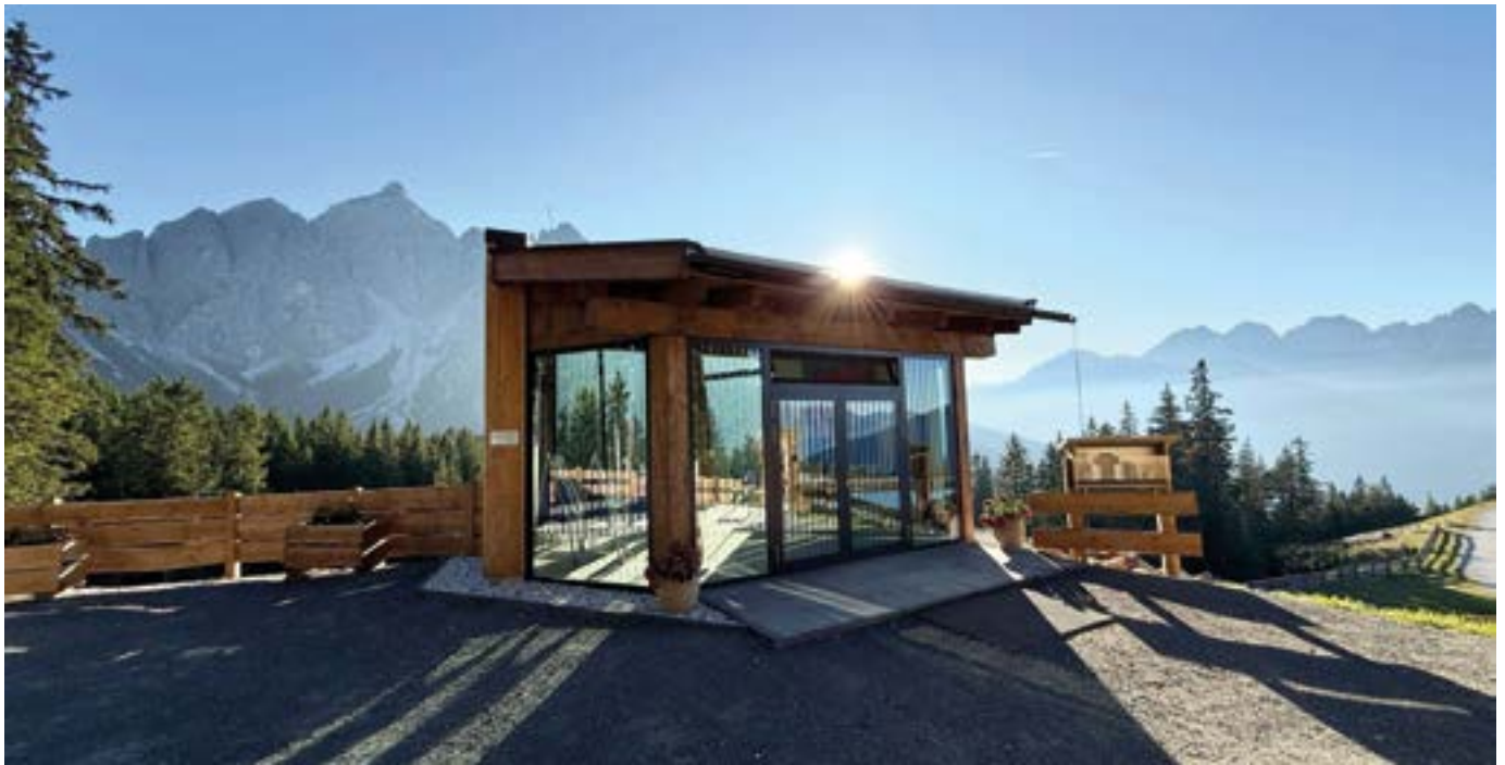
Serleskirchl Abendlicht

Am Sonntag, den 21.09.2025, fand bei strahlendem Spätsommerwetter die feierliche Segnung und Eröffnung des neuen Serleskirchls am Koppeneck statt. Zahlreiche Besucherinnen und Besucher folgten der Einladung und füllten den Platz mit Freude und Dankbarkeit.