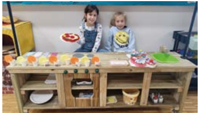
Die neue Holzspielküche - Foto: Hort Mieders

Die neue Holzspielküche ist ein weiterer Schatz in unserem Freizeitbereich. Hier können die Kinder in Rollenspiele eintauchen, gemeinsam „kochen“, kommunizieren und ihrer Fantasie freien Lauf lassen. Natürlich werden die zubereiteten Pizzen, Eisbecher oder Schnitzel in der „Pizzeria bei den lustigen Hühnern“ gemeinsam gekostet und