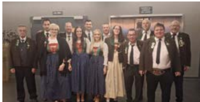
Unsere Abordnung beim Patenverein in Mannheim

Es freut uns, dass unser offenes Luftgewehr- und Armbrustschießen wieder so toll angenommen wurde. Von Mai bis Oktober war unser Schießstand immer am Donnerstag und Freitag Abend offen und jede/r konnte ihr/sein Glück versuchen. Mit den neuen Standgewehren und der digitalen Anlage macht es nun noch mehr Spaß. Ein Highlight war sicher unser Halloween-Schießen, wo man auf speziellen Halloween-Scheiben Geister treffen musste und sich so seinen Kürbis schießen konnte. Zum Abschluss der Saison fand dann noch ein Oktoberfest für alle Mitglieder statt, bei dem der Spaß und die Kameradschaft im Vordergrund standen, aber natürlich auch das Schießen nicht zu kurz kam.