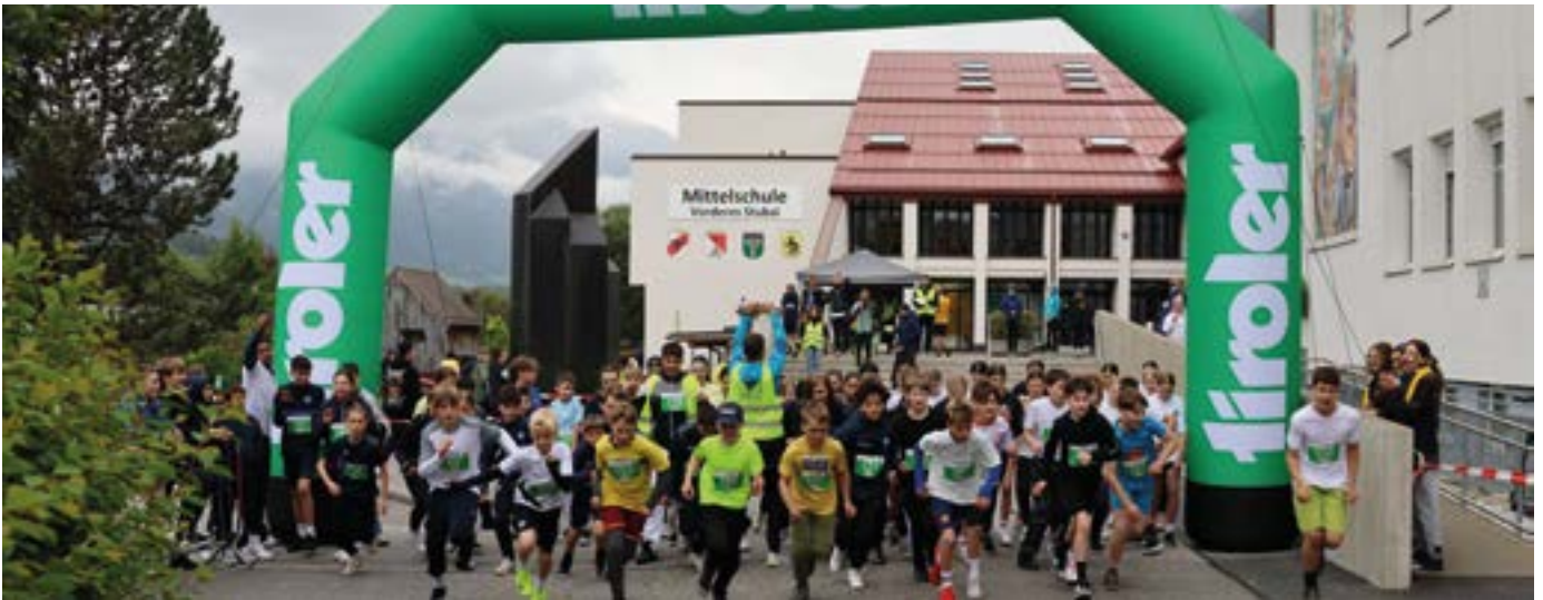
Beim Startschuss zum Schullauf

Laufen wir miteinander füreinander - Unter diesem Motto fand am 23. Mai 2025 der erste Schullauf der Mittelschule Vorderes Stubai statt. Die Motivation der Schüler:innen war riesig und so konnte in etlichen Runden eine unglaubliche Summe von 14.519 € für den Schulfond erlaufen werden. Mithilfe des Fonds werden allen Schüler:innen Klassenfahrten ermöglicht.