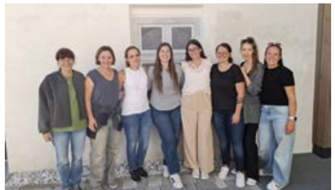
Das Team der Miederer Herzstücke