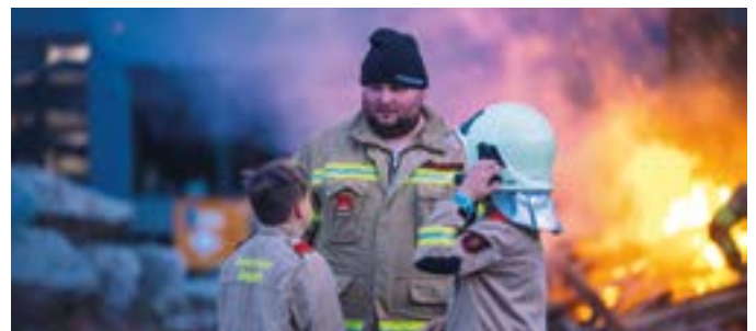
Brandbekämpfung der Feuerwehrjugend

Vielen Dank für die geleistete Arbeit und die zahlreiche Übungsbeteiligung an die Kamerad:innen.