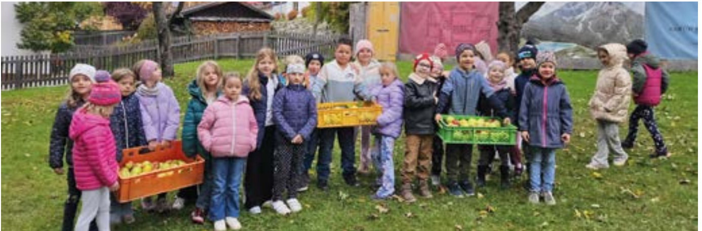
Volksschulkinder Apfelernte

Im Frühjahr gab es heuer gleich drei Veranstaltungen: ein Rosenschnittkurs, einen Vortrag „Kleiner Garten – große Ernte“ und einen Töpferkurs „Kreative Gartendeko aus Ton“, die großen Anklang fanden. Das Gartenjahr 2025 war für die Obst- und Gartenfreunde im Stubaital von sehr wechselhaften Witterungsverhältnissen geprägt. Der Winter verlief über weite Strecken mild, mit wenig Schnee in den Tallagen. Dadurch begann die Vegetation vielerorts ungewöhnlich früh: Schon im März zeigten sich erste Knospen an Obstbäumen und Ziergehölzen. Im April folgte jedoch ein deutlicher Kälteeinbruch mit mehreren Frostnächten. Besonders Marillen und frühe Birnensorten erlitten Schäden an Blüten und Jungtrieben. Die alljährliche Dorfbepflanzung fand nach den Eisheiligen im Mai statt. Die Gemeindebeete, die Rosenbeete beim Pavillon, die Balkonkisterln am Anger und der Schulgarten werden vom Grünraumpflegeteam rund ums Jahr betreut.