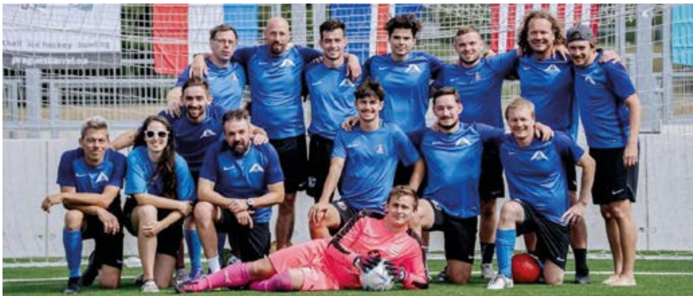
Die Altherren beim Turnier in Prag