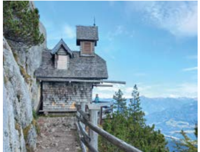
Friedenskirchl am Stoderzinken