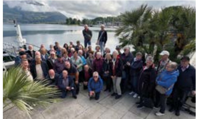
Am Comer See

Der Frühling begann für uns mit einem besonderen Ausflug. Drei Tage lang folgten wir den „Alten Handelswegen im Bergell und Veltlin“. Über das Engadin führte uns der Weg hinauf zum Malojapass und hinunter nach Chiavenna. Am Comer See stiegen wir ins Schiff, fuhren nach Bellagio und weiter bis Abbadia Lariana. Stadtführungen, Einblicke in den Weinbau samt Verkostung, kleine Wanderungen und feines Essen machten die Reise zu einem Genuss für Geist und Gaumen. Ein weiteres Highlight war Schloss Tratzberg. Der kleine „Tratzberg-Express“ brachte uns ins Schloss, wo uns eine exklusive Sonderführung erwartete. Zwischen Renaissance-Pracht und den privaten Gemächern von Kaiser Maximilian I., normalerweise sind diese Räumlichkeiten unzugänglich, durften wir einen Blick in die Geschichte werfen.