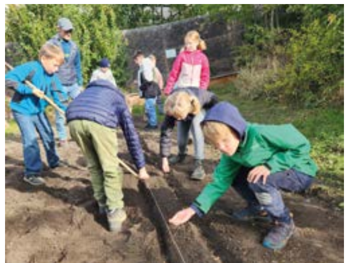
Volksschulkinder beim Getreidesäen

Waldrast wurde auch heuer wieder Ende Juni von engagierten Mitgliedern des OGV Mieders mit viel Liebe hergerichtet. Die Teilnehmer konnten sich vor dem letzten Anstieg auf die Waldrast im Widumgarten stärken. Der Sommer zeigte sich überwiegend feucht, dadurch traten Pilzkrankheiten