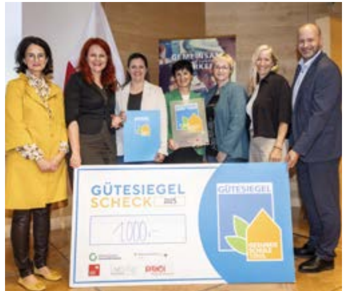
Bei der Übergabe des Gütesiegels