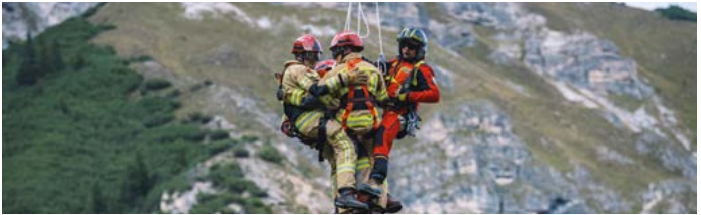
Waldbrandübung Telfes - Kamerad:innen werden zum Einsatzgebiet geflogen

Im Zuge der Haussammlung 2025 wurde jedem Haushalt ein Jahresbericht der Freiwilligen Feuerwehr überreicht. Wir möchten uns hiermit für die großartige Unterstützung der Miederer Bevölkerung durch die eingegangenen Spenden herzlich bedanken. Jeder einzelne Beitrag gibt uns die Möglichkeit, die Freiwillige Feuerwehr auf dem neuesten Stand der Technik zu halten und leistet auch einen wesentlichen Beitrag zur Ausbildung der Feuerwehrjugend.