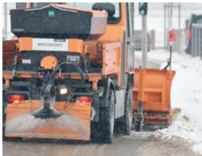
Winterdienst ist eine herausfordernde Aufgabe

(6) Zum Ablagern von Schnee aus Häusern oder Grundstücken auf die Straße ist eine Bewilligung der Behörde erforderlich. Die Bewilligung ist zu erteilen, wenn das Vorhaben die Sicherheit, Leichtigkeit und Flüssigkeit des Verkehrs nicht beeinträchtigt.