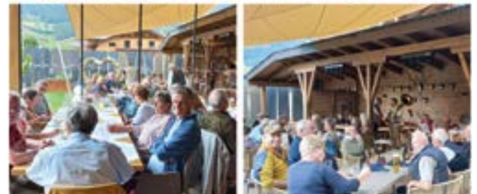
Grillen beim Alpenstolz