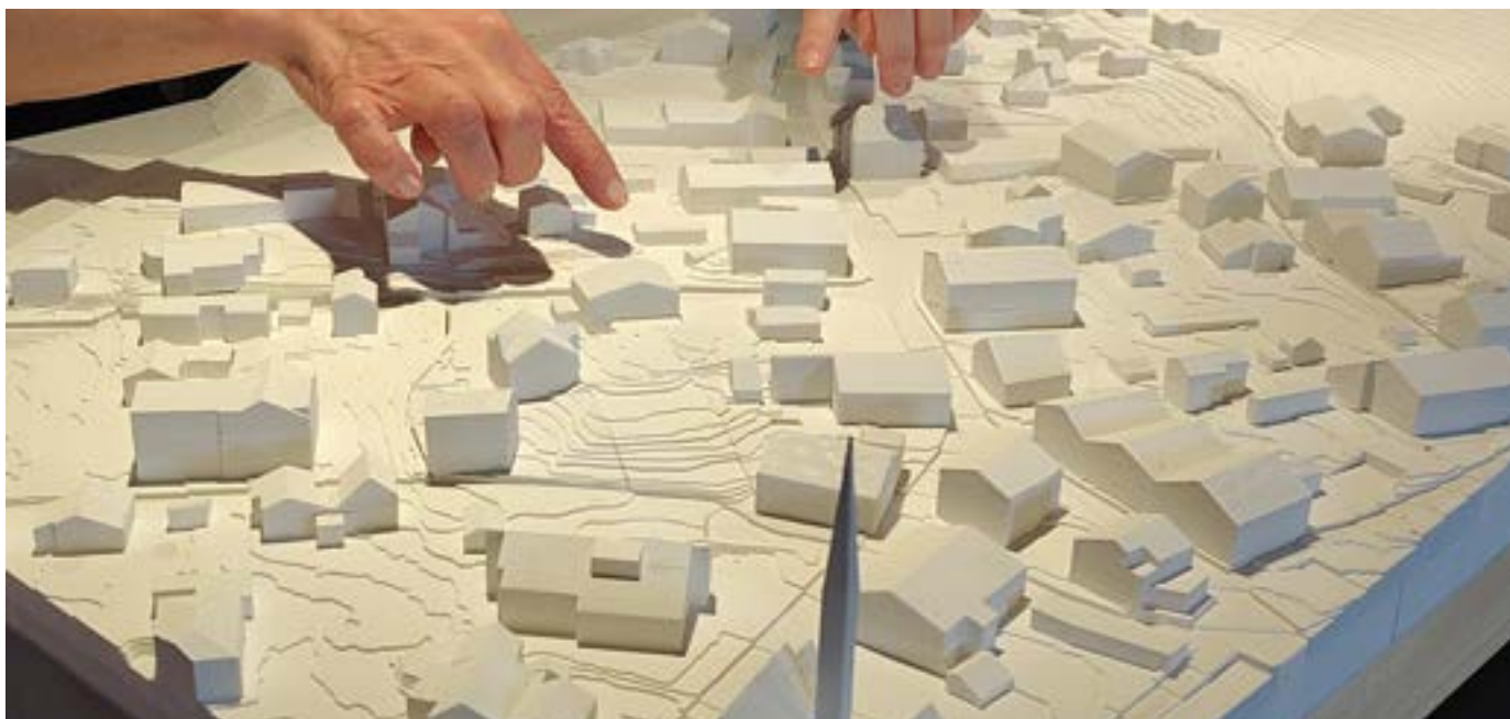
Das Dorfzentrum von Mieders