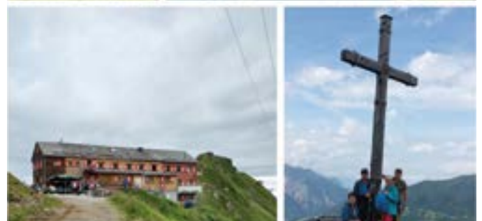
Unterwegs im Montafon