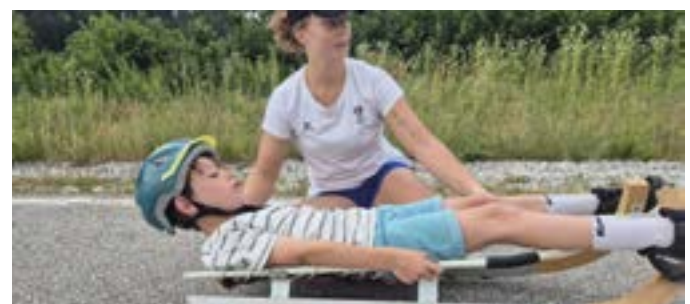
Rollenrodeln Lisa und Piet