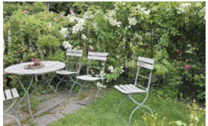
Vereinsausflug Reith i. Alpbachtal Hildegard von Bingen Garten

Die Labestation der Quo Vadis Pilgerwanderung auf die