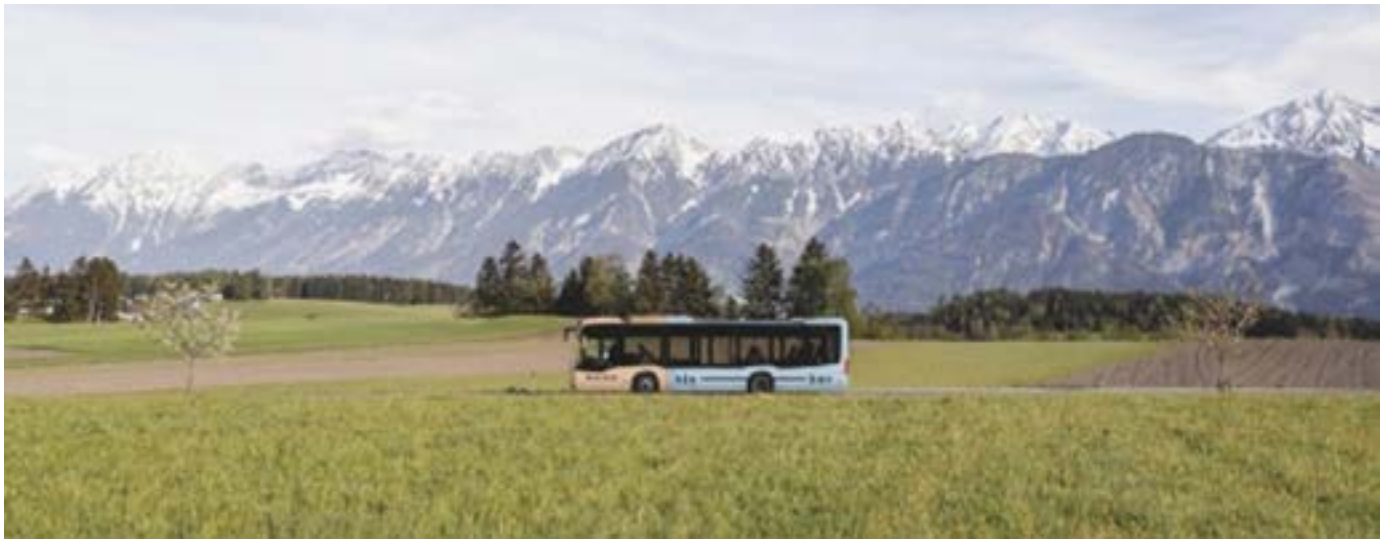
Bus Natur

Für die Bevölkerung des Stubai- und Wipptals wird sich der öffentliche Verkehr ab Mai 2026 durch den Ausbau der Verbindungen enorm verbessern. Ein neues Konzept mit dichtem Takt und bequemen Umsteigemöglichkeiten auf Bus und Bahn schafft beste Voraussetzungen für den Weg in die Arbeit, Ausflüge, zu Sport- und Freizeiteinrichtungen - und macht die Mobilität in der Region insgesamt einfacher, nachhaltiger und attraktiver.