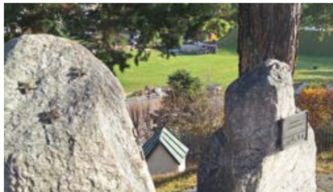
Die Gedenkstätte am Kalvarienberg

In der Kapelle am Kalvarienberg liegen kleine Bronzesterne bereit. Wer möchte, kann sich dort – ganz anonym – einen Stern nehmen und ihn in eine der vorbereiteten Öffnungen am Erinnerungsstein stecken. Eine verantwortliche Person kontrolliert die Stätte regelmäßig und sorgt dafür, dass die Sterne anschließend dauerhaft befestigt werden. So entsteht mit jedem neuen Stern ein wachsender Ort des gemeinsamen Gedenkens, an dem jedes einzelne Leben sichtbar bleibt.