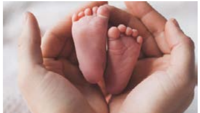
Elternberatung Tirol in der Kinderkrippe Mieders

Jeden 3. Dienstag im Monat (außer an Feiertagen) 14:00 – 15:30 Uhr - Kinderkrippe Mieders, Widumgasse 2 Es ist keine Anmeldung erforderlich. Alle Familien sind herzlich eingeladen, während der Beratungszeiten zu kommen,