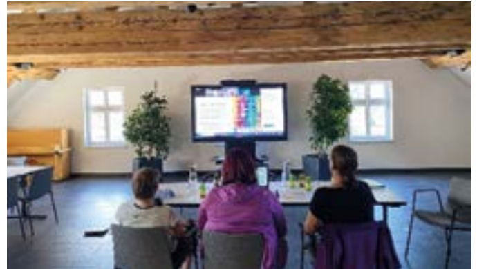
Bei einem Online-Meeting