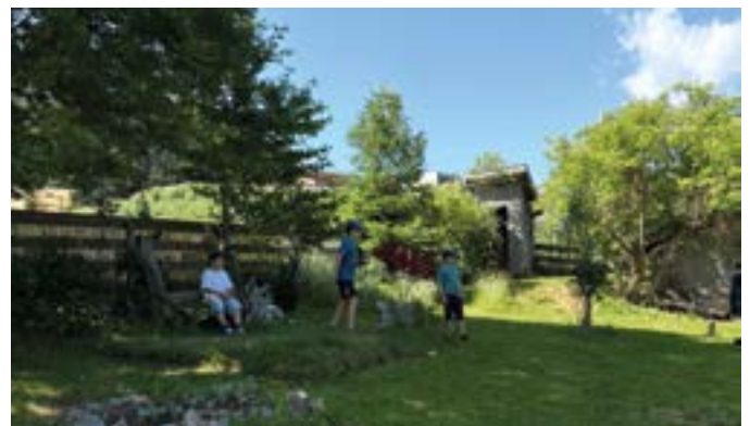
Am neuen Naturschauplatz

Auch die Gemeindegutsagargemeinschaft freut sich, dass das Grundstück auf diese Weise sinnvoll genutzt wird. „Es