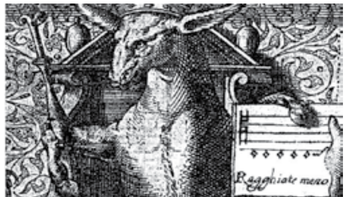
NEA (Noblesse & Excellence de l'Asne) - association sans but lucratif - loi 1901 - Foto: NEA

Das Konzert, auf historischen Instrumenten (Blockflöten, Gamben, Barockfagott), hat einen sehr guten Anklang gefunden, wie schon in den Vorjahren; das Bezirksblatt Wipptal - Stubaital brachte eine Ankündigung des Konzertes; die Besucher (Eintritt frei) waren über die hohe Qualität der Veranstaltung begeistert: das lokale Publikum, an Musik sowie an dem architektonischen Kulturerbe interessiert, war besonders erfreut über die Möglichkeit, ein barockes Konzert zu erleben an einem Ort, wo es gewöhnlich keines zu hören gibt; auch den Gästen wurde hiermit die Gelegenheit