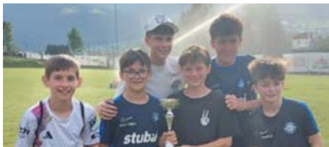
Die Sieger beim Gedenkturnier der Kinder: FC Abseitsfalle