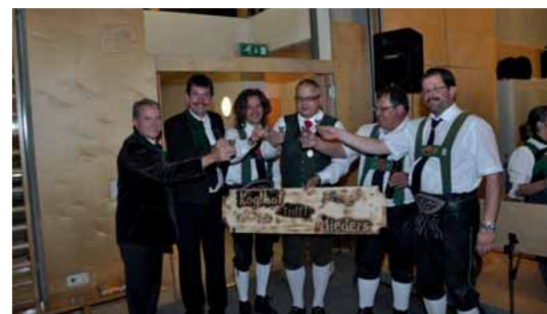
Auf die Freundschaft