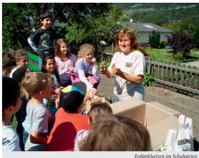
Erdäpfelsetzen im Schulgarten