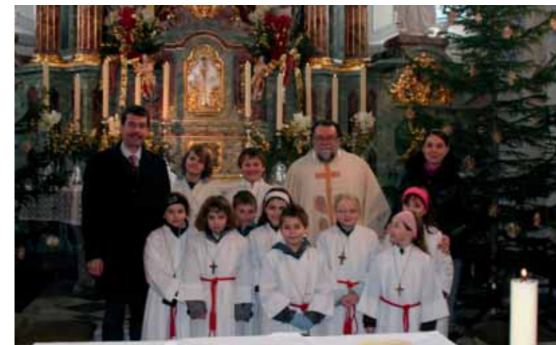
Unsere fleißigen Ministranten

Ministranten sind junge Menschen die sich von Christus anstecken lassen und zum Dienen bereit sind. Ministranten sind Christen, die mitdenken und zupacken, damit in der Kirche Leben ist. Ministranten erleben Spaß und Zusammengehörigkeit in der Gemeinschaft. Ministranten, ein Stück Gemeinde, die Licht in unsere Welt bringen.