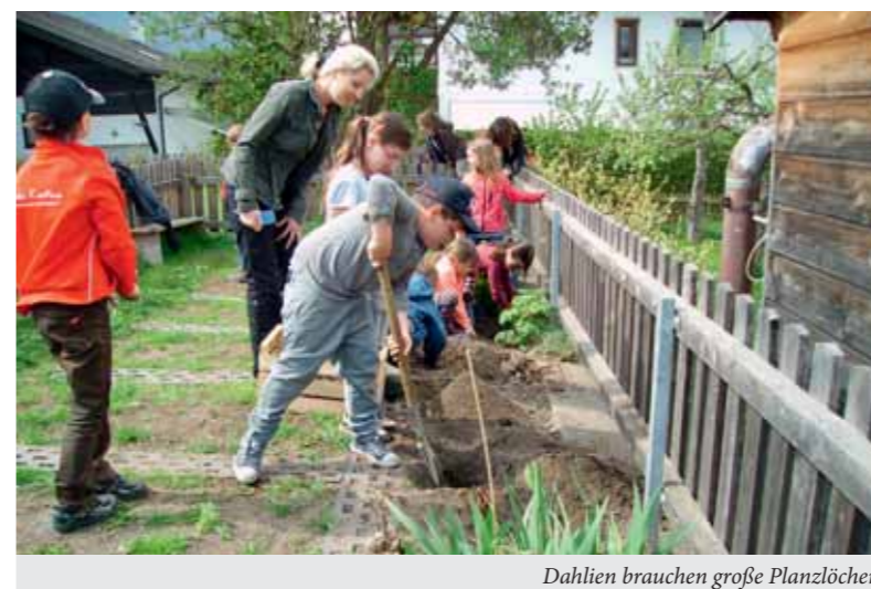
Dahlien brauchen große Planzlöcher

der Brennnesselspitzen war für viele eine Mutprobe.