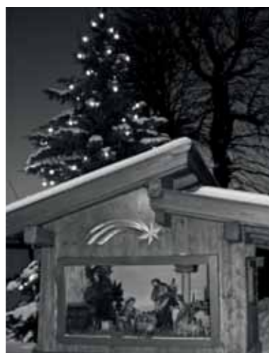
Dorfkrippe Mieders