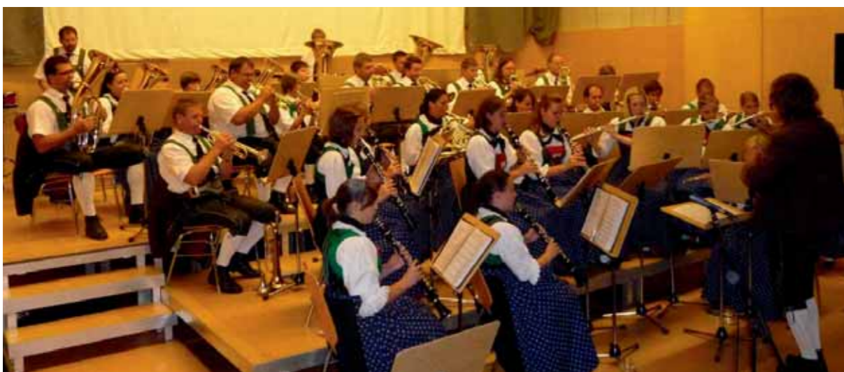
Konzert in der Mehrzweckhalle Koglhof