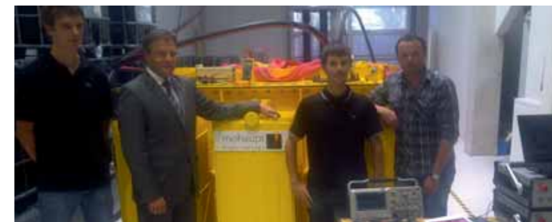
LH Günther Platter informierte sich bei den Mitarbeitern