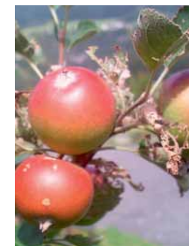
1. Apfelernte beim SV-Obstanger

Mandl und Angela Pernsteiner die vorbereiteten Äpfel aus Miederer Obstgärten gewaschen, gemahlen, gepresst und jedes Kind konnte ein Flasche des köstlichen, naturbelassenen Apfelsaftes nach Hause mitnehmen. Am 28. September fand das Kar-