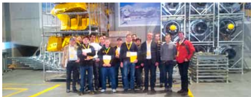
Foto: Die Belegschaft der Serlesbahnen und die Gemeindeführung am Betriebsgelände der Techno Alpin in Bozen.

Die Belegschaft der Serlesbahnen Mieders und die Gemeindeführung besuchten im Rahmen einer Exkursion die Techno Alpin in Bozen, um sich über die Neuigkeiten am Markt zu informieren. Vor allem die Vorstellungen bei der Messe im Bereich der Beschneigungsanlagen waren für alle sehr interessant und informativ.