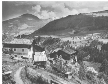
Im Jahre 1973

Vom Samstag, den 8. bis Dienstag, den 11. September zeigt eine Ausstellung im Freizeitzentrum von Neustift den Wandel der Kulturlandschaft in den vergangenen 150 Jahren und wagt einen Blick voraus, entwirft Szenarien für die Stubai-Landschaft der Zukunft. Auftakt zu der Ausstellung ist eine Podiumsdiskussion am Freitagabend, 7. September. Zu beiden Veranstaltungen ist