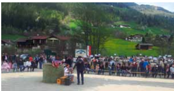
Foto: Die Grauviehausstellung in Neustift