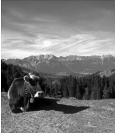
Blick von der Ochsenhütte Mieders zur Nordkette - Innsbruck und Gleins - Schönberg